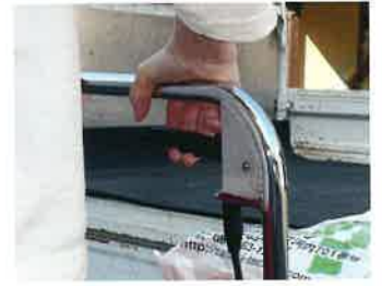
ハンドルを握るとテーブル下がります。