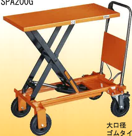
大口径 ゴムタイヤタイプ