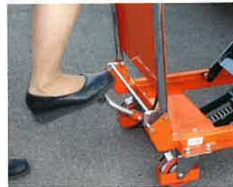
ペダルを踏むとテーブルが上がります。